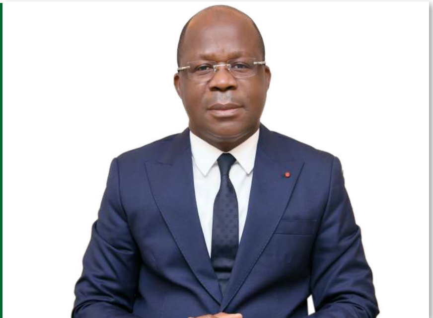
Pierre N'Gou DIMBA

Ministre de la Santé, de l'Hygiène publique et de la Couverture maladie universelle